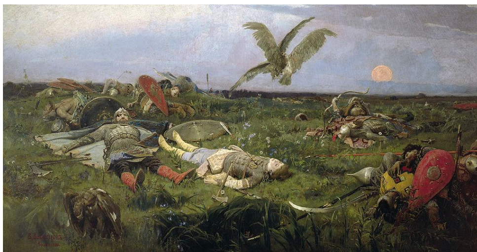
В. Васнецов. После побоища Игоря Святославича с половцами

В олимпиаде «Сергей Сергеевич Прокофьев» предложено подумать, с музыкой какого произведения созвучна картина Василия Васнецова, назвать его (Кантата «Александр Невский», «Мёртвое поле») и описать, какие средства музыкальной выразительности использовал композитор для создания музыкального образа.